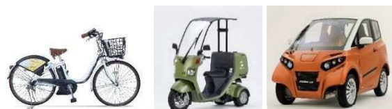
電動アシスト付自転車 スクーター 超小型EV 実証実験で利用するモビリティのイメージ