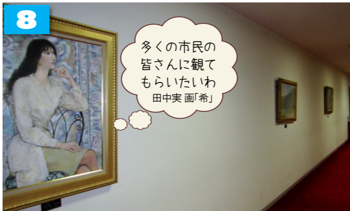
浦和市議会時代から議会棟廊下に展示の素晴らしい絵画は市民の財産