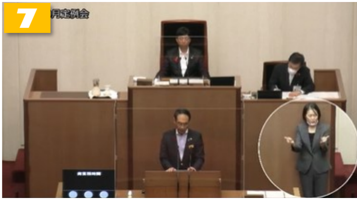
インターネット議会中継に手話通訳の導入を(画面=埼玉県議会より)